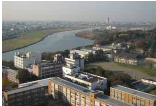
悠久の流れ 江戸川(太日川)和洋女子大展望テラスより

遺跡見学の前後には国重文の「旧徳川家松戸戸定邸」「中山法華経寺伽藍」見学も組入れました。ガイドいただいた松戸シティガイド、市川案内人の会の皆様に誌上を借りて御礼申し上げます。参加会員からは和洋女子大資料館が印象に残ったようで一様に「きれいだった」との感想をいただきましたが、内容は女性会員「テラスからの景観」、男性会員「案内いただいた妙齢の学芸員」のことでした。(中村 記)