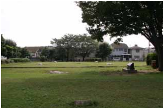
下総国分尼寺跡遺跡公園

連の遺物を見学、展望テラスから国府跡が推定される市営野球場を中心とした国府跡や江戸川を俯瞰して往時の姿を偲びました。